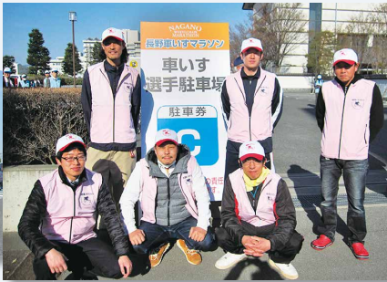
第 13 回 長野車いすマラソン大会ボランティア