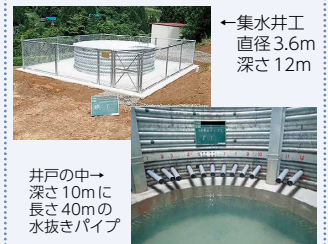
←集水井工 直径3.6m 深さ12m