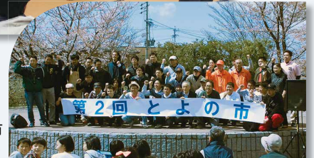
第 2 回 とよの市 (豊野支部青年部)