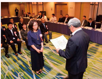
長崎部長（川中島支部女性部長）

今後の更なる、当女性部の「青色防犯パトロール」活動に期待するとともに、これまでの尽力に敬意を表したいと思います。