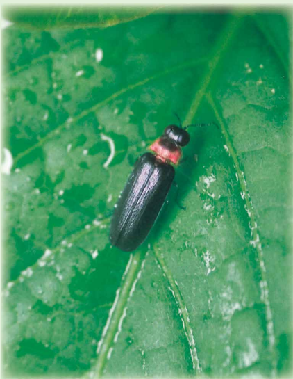
ヒメボタルの成虫 (約6～7mm)

「ヒメボタル」は、長野県の場合、一般的に深い山の中に発生しますので、「山ボタル」とも呼ばれ、つい近年までは、山仕事をしている人や登山者、溪流釣りを楽しむ人などごく一部に知られているだけの「ホタル」でした。ゲンジボタルやヘイケボタルと並んで発光の美しいホタルとして知られていますが、生活の仕組みは根本的に違います。ゲンジボタルやヘイケボタルが幼虫時代を水の中で過ごす水生のホタルであるのに対して、ヒメボタルは一生を地上で過ごす陸生ホタルです。