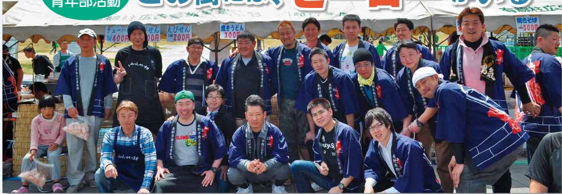
第 19 回 長野マラソン大会物販