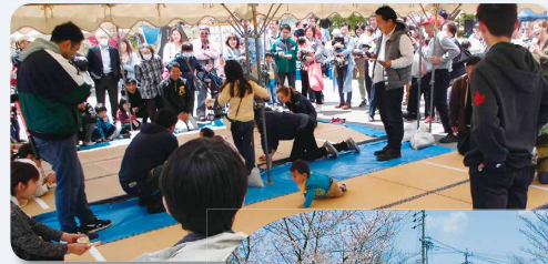
赤ちゃん ハイジャイリース