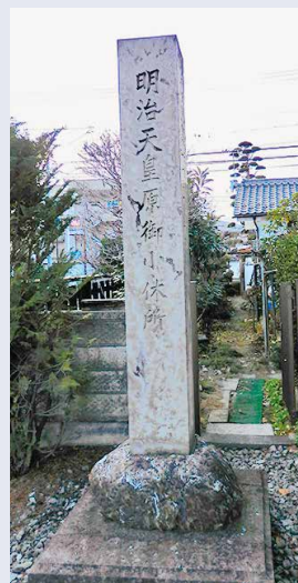
明治天皇小休所跡の碑