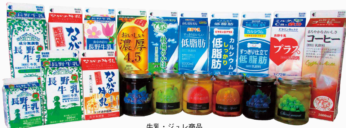
牛乳・ジュレ商品

●安全、安心な製品を 私たち長野牛乳は、その長い歴史の中で常に安全、安心で高品質な製品を生み出す努力を重ねてきました。そしてこれからも新たな時代に向けて「人々の健康づくりを通じて社会を築くこと」という企業理念のもとに、邁進したいと考えています。