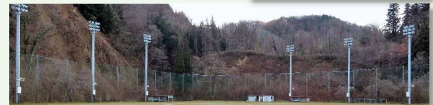
中条中学グラウンド照明