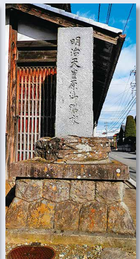
明治天皇御膳水の碑