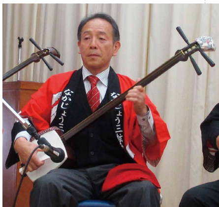
支部商工祭りにて