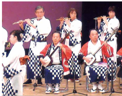
長野市甚句音頭交流会にて

そうですね、簡単なことではないとは思いました。なぜなら当時、行事等で耳にする「西山小唄」はレコードを流したものでしたから、