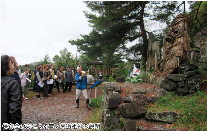
保存会の方による芦ノ尻道祖神の説明

大岡支部では、県指定無形民俗文化財となっている「芦ノ尻道祖神」を訪れました。これは、平成十年二月の長野冬季五輪の閉会式に登場したことでご存知の方も多く、「一度観たかった」との声が多くありました。芦ノ尻道祖神保存会の方から、各戸から持ち寄ったしめ縄で道祖神の石碑に飾り付けることは明治初期から始まったとされており、疾病などに対しての村の守り神、心のよりどころとして作られた道祖神を守り継承して行きたいという説明を受けました。