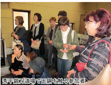
秀平鍛刀道場で玉鋼を触る参加者