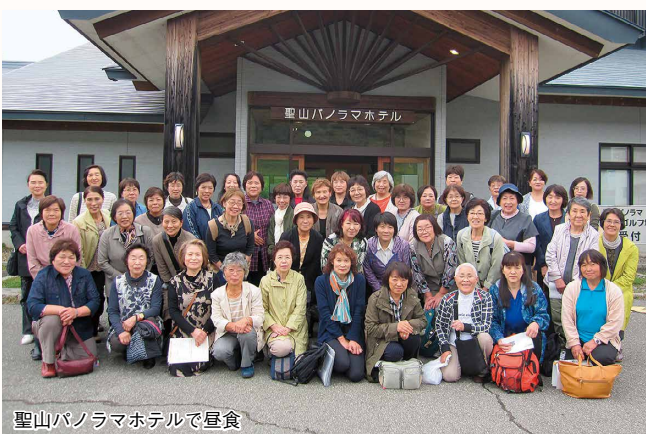
聖山パノラマホテルで昼食

普段あまり訪れることがない場所を数多く見ることができ、地域の良さを再認識した視察研修となりました。