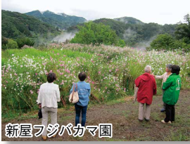
新屋フジバカマ園

最初に、七二会支部の新屋フジバカマ園を訪れ、小さなピンク色の可愛らしい花畑に舞う「アサギマダラ蝶」を見ることができました。この蝶が飛来する場所を整備している地域の方から、アサギマダラ蝶は日本列島を横断し、さらに沖縄や台湾まで二千キロ以上を飛翔する蝶だという話をお聞きしました。