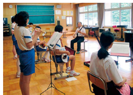
中学校での指導風景

ところで、伝統芸能とは別の話になりますが、「西山小唄」を通じて音楽や楽器に触れる機会に恵まれたので、他の楽器にも挑戦してみたいなりました。私の3人の子どもは中学・高校と吹奏楽部に所属していましたから、お願いすればきっと教えてもらえると思うんです。そうしていつか、それぞれに好きな楽器を選んで家族合奏ができたらそれも最高ですよ!