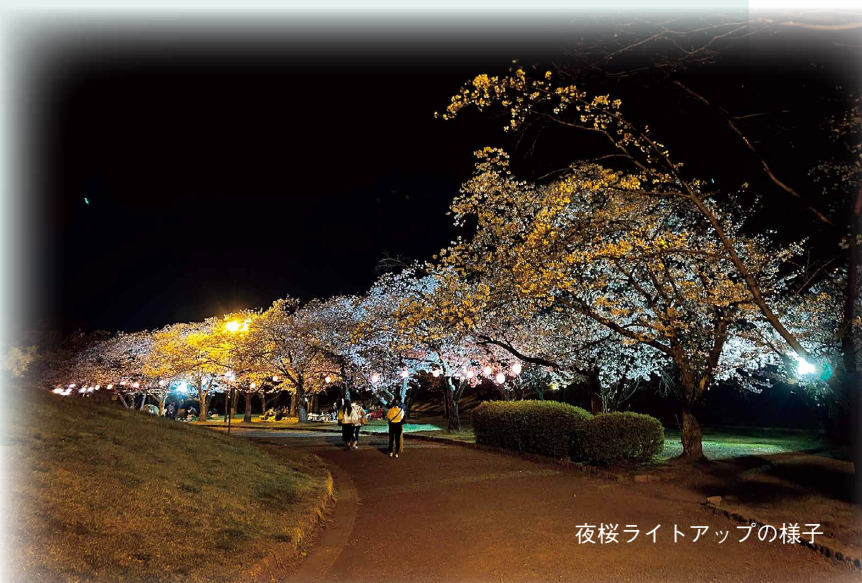
夜桜ライトアップの様子