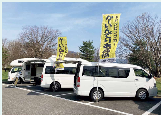
キャンピングカー展示