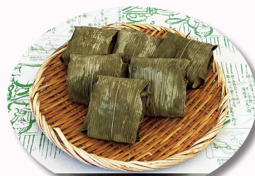
七二会おやき各種