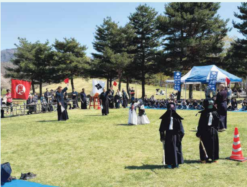
川中島合戦剣道大会 三太刀杯

中でも、4月12日(日)に川中島古戦場芝生広場にて行われた「川中島合戦剣道大会 三太刀杯」では、更北・川中島地域の剣道クラブに所属する小中学生たちが、川中島合戦をイメージして武田軍と上杉軍に分かれ、対抗野試合を繰り広げました。