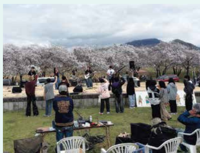
高校生ロックフェス in 古戦場