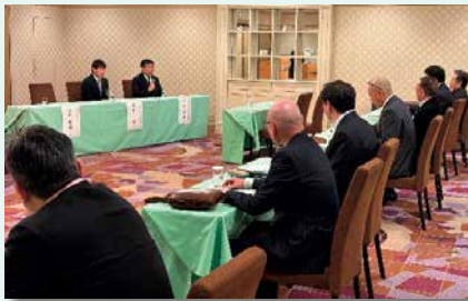
懇談会（質疑応答）の様子