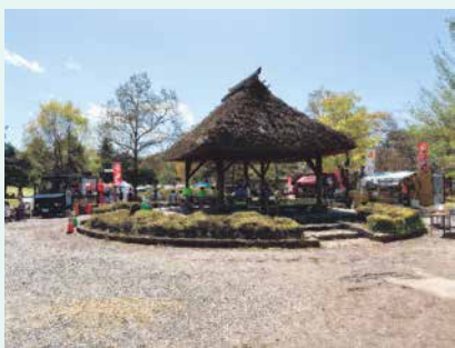
ラーメン博 in 古戦場

まして、子供たちを中心に大勢の皆様楽しんでいただくことができました。 今回の取り組みを来年以降も継続し、川中島古戦場史跡公園を地域の子供たちに身近な場所として活用していただくことで地域活性化を図るとともに、更北地域のすばらしさを多くの方に伝えていければと考えております。