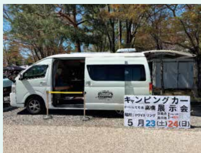
キャンピングカー展示会