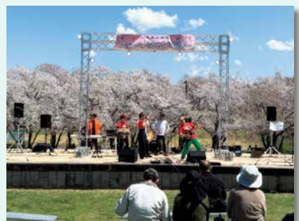
フォークジャンボリー