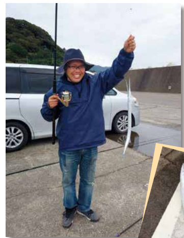
ダツを釣りました！

ここでの「諦める」とは、その日やりたいことを1つ決めたら他は考えない、という意味です。的を1つに絞れば迷いなく1点に集中できます。もし時間が余ってもそれはそれ。急きょ予定を追加しても中途半端になるだけな